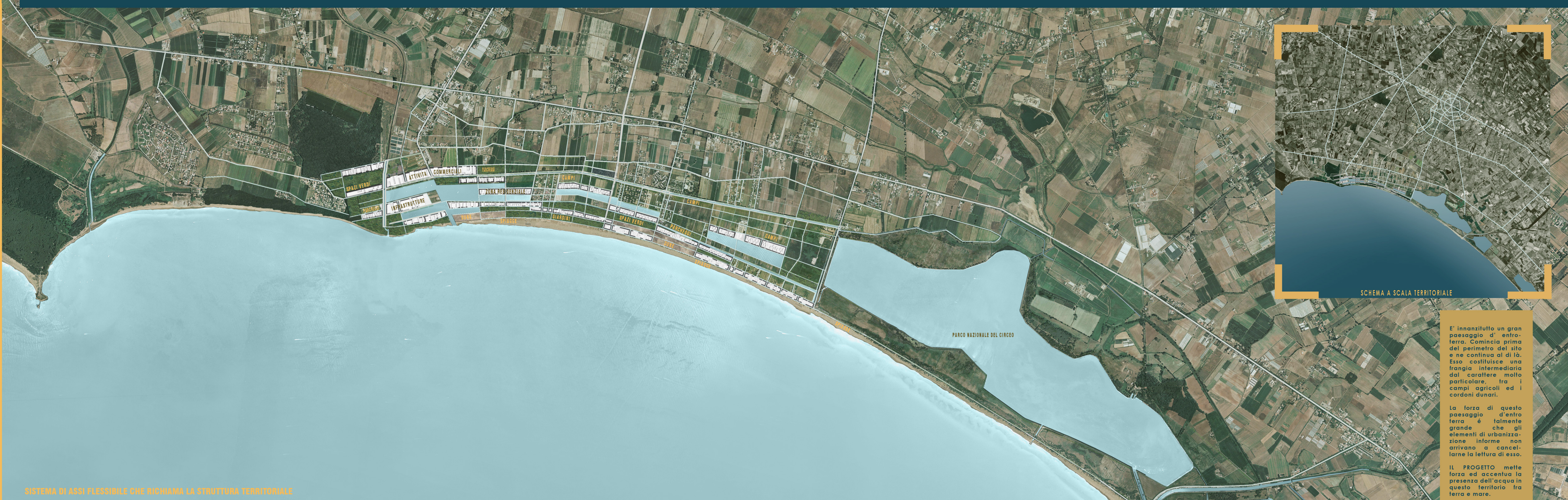
SCHEMA A SCALA TERRITORIALE